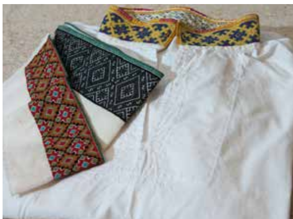
Bunadskjorte med smøyg broderi av Inger Petersen.