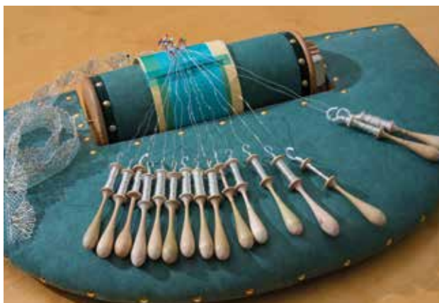
Kniplepute med kniplinger i sølv som Iljen Honstad bruker.

Bildene her viser blant annet et lite utvalg av produkter laget av handverkerne i husflidslaget