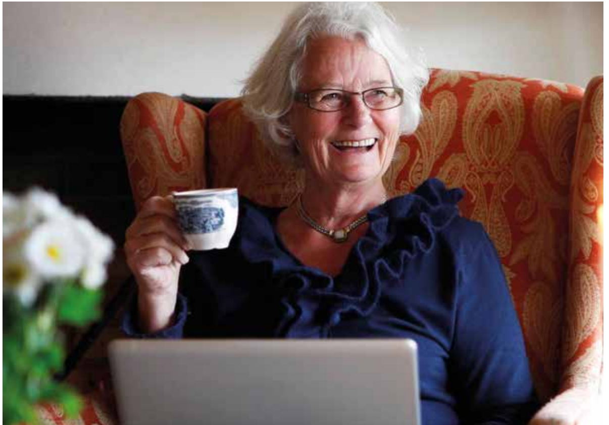
Foto: Seniornett Norge, tidligere leder | Tekst: Seniornett Norge

D igital kompetanse regnes i dag som en basisferdighet og det forventes at alle har kunnskaper nok til å kunne bruke nettbank og offentlige tjenester på nett, som for eksempel NAV og Altinn. Men med den hurtige digitaliseringen opplever flere at de faller utenfor både i arbeidslivet og i hverdagen, og tilbudene for opplæring er få.