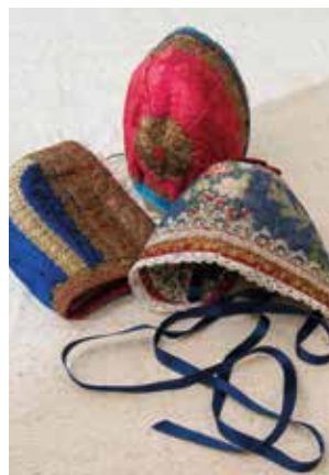
Dåpsluer i silke etter gammel modell, av Inger Petersen.