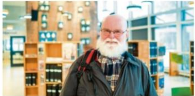
PÅ BIBLIOTEKET: Porsgrunnsmannen er nesten daglig en tur innom biblioteket i Skien. Her kan han lese de avisene han selv ikke abonnerer på.